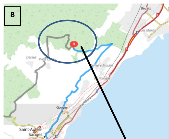
La Rouvraie, Route de Chatillon, Bevaix